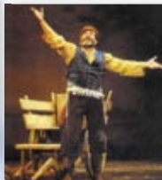
חיים טופול המחזמר "נבר על הגג", עפ"י ספרו של "שלום עליכם"