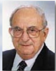
5. יצחק נבון