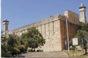
מערת המכפלה. מקום קבורת האבות, חברון