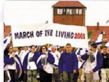
מצעד החיים - פולין