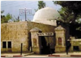
קבר רחל, בית-לחם