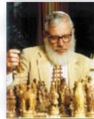
פרופ' יעקב און. זוכה פרס נובל לכלכלה 2005