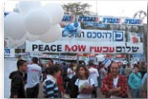
הפגנת שלום, כיכר רבין, ת"א. עכשיו! 'שלום עם גוש קטיף' v