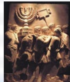
תבליט שער טיטוס

המנורה המופיעה בסמל המדינה מעוצבת בדומה למנורת בית המקדש החקוקה על שער טיטוס שברומא. הרומאים הנצחו בתבליט זה את נצחונם על היהודים והגלייתם. קביעת מנורה זו בסמל המדינה, היא סמל למהפך שחל עם הקמת המדינה, והיא מבטאת את נצחונו ונצחיותו של עם ישראל.