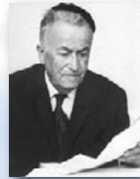
ש"י עגנון. זוכה פרס נובל לספרות.