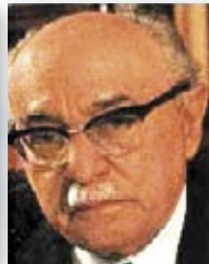
3. זלמן שזר