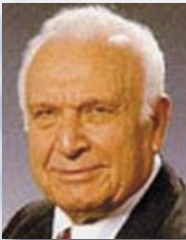
4. אפרים קציר