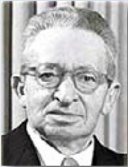
2. יצחק בן צבי