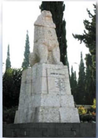
האריה השואג תל-חי

כח העמידה הישראלי נתון מזה זמן רב במבחן קשה. הטרור מכה שוב ושוב, ואנו הולכים ונשחקים. אנו זקוקים כעת, יותר מתמיד, לאותה אמונה בייחודו של עם ישראל ובשליחותו בעולם. אנו זקוקים לחיזוק כח העמידה שלנו, לחיזוק האהבה למולדת ולאותה מסירות שעליה אנו קוראים בסיפורי תש"ח.