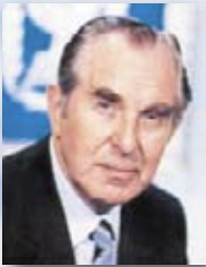
6. חיים הרצוג