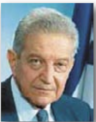
7. עזר וייצמן