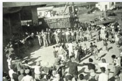
ירקודים בעקבות החלטת האו"ם על הקמת המדינה