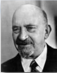
1. חיים וייצמן