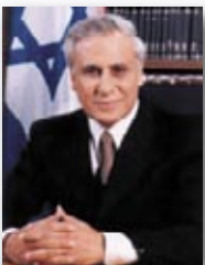
8. משה קצב