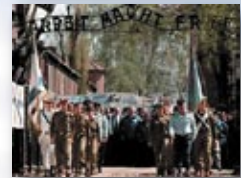
חיילים בפתח מחנה ההשמדה 'אשוויץ'