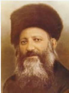
הרב אברהם יצחק הכהן קוק זצ"ל, הרב הראשי הראשון לארץ ישראל