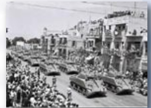
מצעד יום העצמאות בחיבת ת"א

וגם אם ארוכה הדרך ורבה הדרך הן כוחנו עוד רב וגם אם ארוכה הדרך ורבה הדרך נעבור בה יחדיו ועד לשערי רקיע בוודאי נגיע עוד מעט אם לא עכשיו ועד לשערי רקיע בוודאי נגיע כי דרכנו לא לשווא