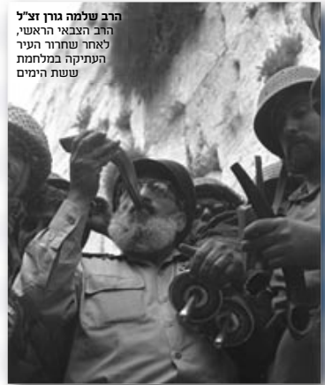
הרב שלמה גורן זצ"ל הרב הצבאי הראשי, לאחר שחרור העיר העתיקה ממלחמת ששת הימים