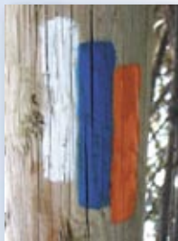
סימון "שביל ישראל"