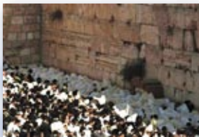
ברכת כהנים חול המועד סוכות, הכתל ירושלים

במגילת העצמאות הכריזו מייסדי המדינה כי היא "תהא מושתתה על יסודות החירות, הצדק והשלום לאור חזונם של נביאי ישראל" - ערכי מוסר ותרבות אלה הם הבסיס לחיינו הלאומיים והפרטיים כאן ועכשיו במדינת ישראל.